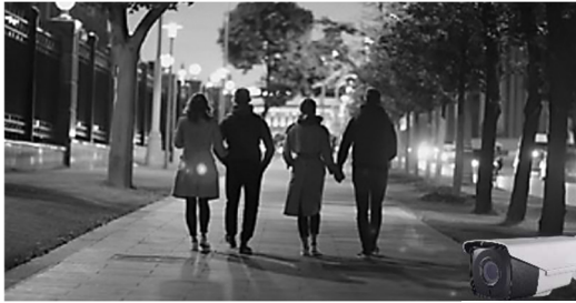
一般的な赤外線LED搭載カメラ